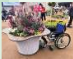
会場飾装(コミュニティプランター)