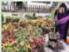
釜川ふれあい広場

＼ 昨年5箇所だったチェックポイントが、6箇所にバージョンアップ！！／ 今回のチェックポイントは、去年のチェックポイントに加え、宇都宮城址公園おほり橋です。また、チェックポイントを結ぶルートとして、釜川プロムナード、みはし通り、本丸通り、みどりの小径、シンボルロードも彩りました🌸