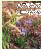
ヒアシンズ ローマン系