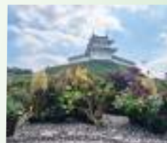
宇都宮城址公園北側