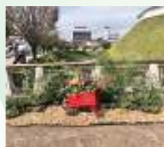
宇都宮城址公園おほり橋