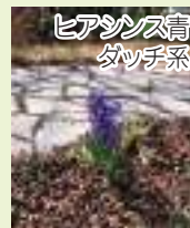
ヒアシンズ青 タッチ系

ヒアシンズは、春の花壇を彩るポピュラーな秋植え球根です。葉と花とのバランスがよく、均整のとれた草姿でボリューム感もあり、強い香りを漂わせます。日本では、10品種ほどが栽培されています。分類上はキジカクシ科に属しますが、ヒアシンズ科orユリ科で分類される場合もあります。花後の球根は入梅前に掘り上げた方が良いでしょうが、私は地植えのままにしています。3~4年間は放任でも大丈夫でした。一般的なタッチ系は、自然に分球して球根が増えていくことはほとんどありませんが、ローマン系は、何もしないでも自然に分球していきます。植えばなしで毎年咲いて、球根が増えていくのでどんどん大きな群生に育っていきます。一つの球根から複数の茎が伸びるので、一本の茎につく花数が少なくても、全体としては見応えがあります。草丈は、全体的に小ぶりでコンパクトな印象になります。