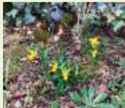
水仙(ラッパ咲き種)

ヒガンバナ科に属し、花形・花色・草姿などから12系統に分類されており、代表的な種類に、ラッパスイセン、八重咲きスイセン、房咲きスイセン、口紅スイセンなどがあります。左写真は房咲き種で、5年前に球根を植えたままの株です。右側の青花は定番のムスカリ(キジカクシ科)で、鮮やかな青紫色の花が春の花壇を彩り、チューリップなどほかの花を引き立てる名脇役です。植えばなしでも毎年よく咲き、グラウンドカバーとしても利用しやすいです。右写真はラッパ咲