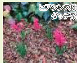
ヒアシンズ桃 タッチ系