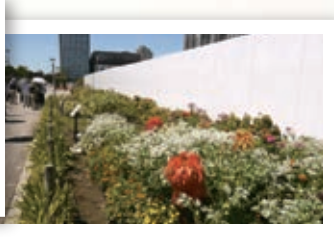
タネだんごから作ったタネだんご花壇