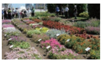
ずらりと様々な苗が並ぶ「トライアルガーデン」