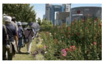
夏でも元気に咲く「タイタンピカス」

午後には自由行動で、ヴィーナスフォート内で行われていたブーケ展示会を見学したり、サマーガーデン人気投票に参加したり、お土産を購入したりと、各自が学び、楽しみながら日程を終えました。真夏の暑さを乗り越える花の姿に元気をもらい、有意義な視察研修になりました。