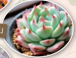
エケベリア属「桃太郎」