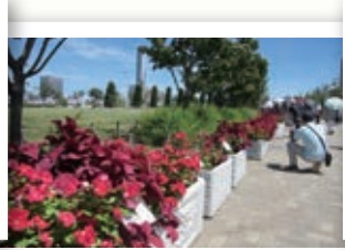
夏の育成に適したお花を選出するコンテスト