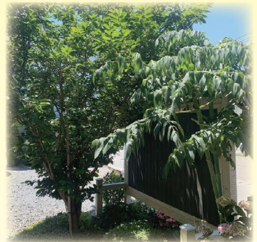
サクランボの木と皇帝ダリア

「四季を通してお花で飾ってほしい」と語るお母様。そんなお母様が手掛けるお花たちのほとんどがプランターに植えられているため、お花によってお水をあげる量や頻度を変えて大切に育てられています。